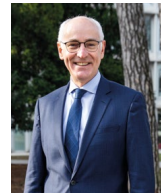
Thierry Repentin PRÉSIDENT DE L'ANAH

Pour réussir, l'Agence sait pouvoir compter sur l'engagement et la mobilisation des collectivités locales qu'elle accompagne dans la définition et le pilotage de leur politique locale de l'habitat privé, en mettant à disposition une expertise, des outils et des financements.